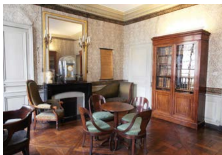
Maison d'Auguste Comte