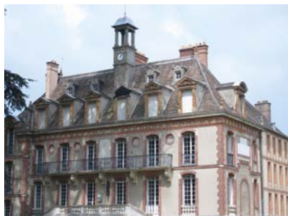
Les Granges - Port-Royal-des-Champs