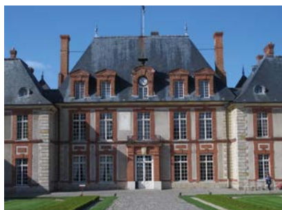
Château de Breteuil

Lorsque vous vous rendez chez l'un de nos sponsors, mentionnez votre appartenance à notre association, ce sera pour ce commerçant qui nous soutient un juste retour.