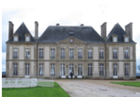
Haras du Pin