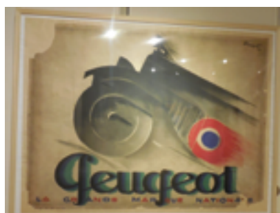
Exposition Loupot Bibliothèque Forney

Merci à Élisabeth Vincent pour avoir animé pendant de très nombreuses années les rencontres jeunes mamans tous les mardis matin, au marché du Trosy. En effet, suite aux travaux de réfection du marché cette activité ne pourra plus se poursuivre. Aucun local n'est prévu par la municipalité dans le nouvel aménagement de ces locaux. Nous le regrettons vivement.