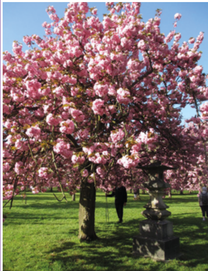
Les cerisiers – parc de Sceaux – avril 2018

Lorsque le rendez-vous est prévu sur le lieu de visite, les personnes qui souhaitent faire le trajet en groupe peuvent se renseigner auprès des permanences pour connaître les noms des participants et ainsi les contacter pour regroupement éventuel.