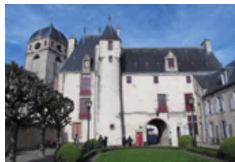
Maison d'Ozé Alençon