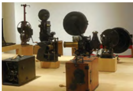
Fondation Jérôme Seydoux

Photo : Monument et borne de la Libération (rond-point du Général Leclerc)