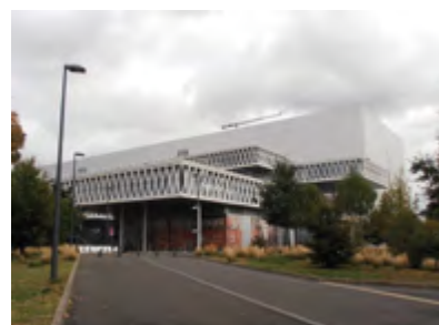
Archives nationales de Pierrefitte