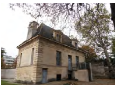
Maison du Fontainier