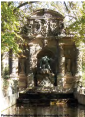
Fontaine Médicis Jardins du Luxembourg