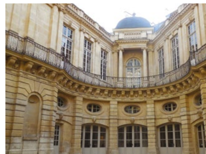
Hôtel de Beauvais

FLÂNERIES - VISITES – CONFÉRENCES Désistements, hors permanences, sur répondeur : 01 71 10 84 43