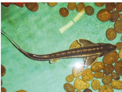
Musée-aquarium de la Seine

Photo Évelyne Plassart : 9 rue Chef de Ville, lieu de l'arrestation de Condorcet. Riche demeure construite au 17 ème siècle. Dotée d'une élégante façade et composée d'un avant-corps central à bossage continu et d'un large portail tenant lieu de porte cochère.