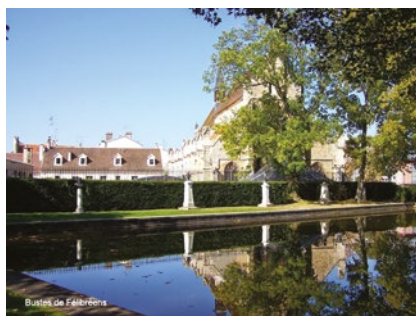
Le jardin des Félibres - Sceaux