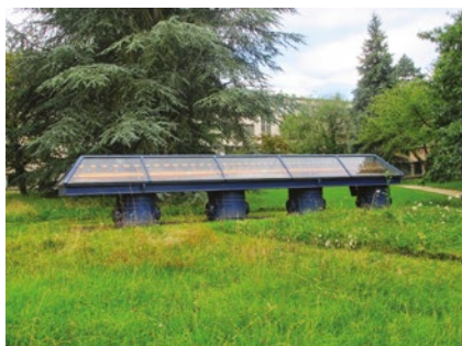
Le Linac – Orsay

Nos sponsors : lorsque vous vous rendez chez l'un de nos sponsors, mentionnez votre appartenance à notre association, ce sera pour ce commerçant qui nous soutient un juste retour.